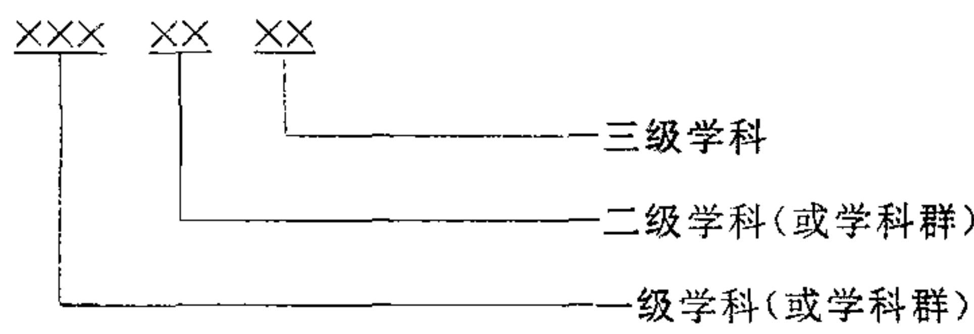
图 1 学科分类代码结构

6.1 本标准的学科分类划分为一、二、三级学科三个层次,用阿拉伯数字表示。一级学科用三位数字表示,二、三级学科分别用两位数字表示,代码结构见图 1。